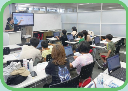
IT・プログラミング