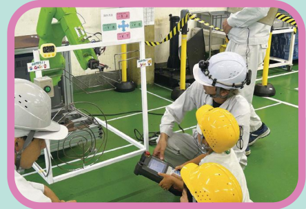
工場見学・機械操作