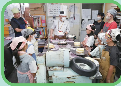
食品・お菓子作り