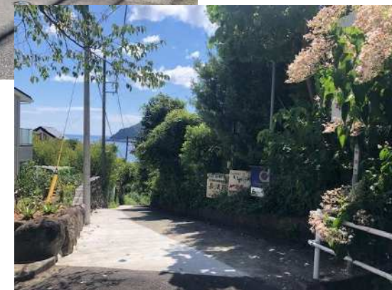
②幹線道路を一步離れると広がる閑静な住宅地