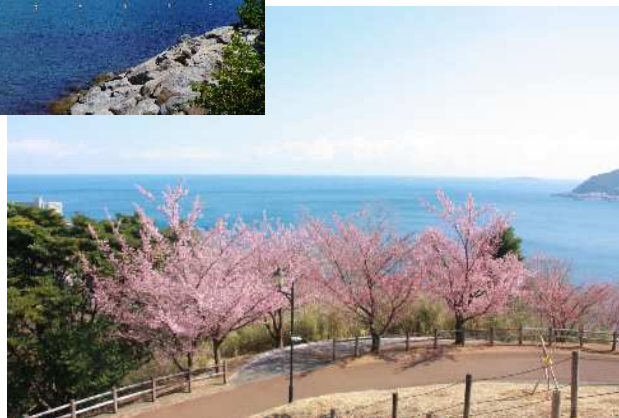
①長浜海浜公園やさくらの名所散策路など、 海と山の自然を満喫できる観光資源が点在