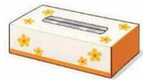
ティッシュの外箱や 窓あき封筒 (フィルム付)