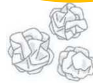
使用済みのちり紙等