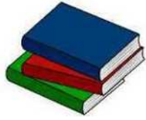
本・雑誌・カタログ・パンフレット