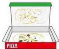
食べ物汚れが付着