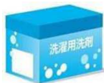
洗剤の匂いが付着