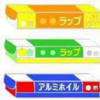
ラップやアルミホイルの 外箱(刃付)や芯