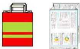
紙袋や広報誌等を用いた 自作回収袋に入れる