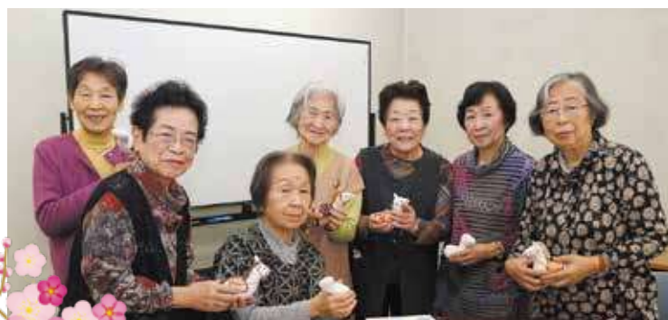
熱海地域活動連絡会の皆さん