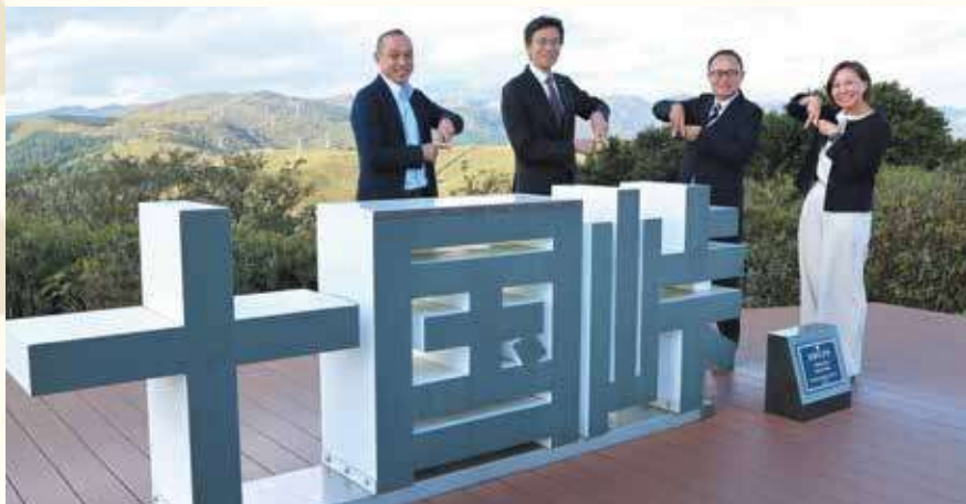
熱海市と函南町の境にある十国峠

していただける舞台をようやく 始動できたことを、とても嬉し く思っています。 自分の目指すところは温泉リ ゾートですが、観光業を憧れの 産業、職場にすることが究極の 目標です。 そこで働く市民を中心とした 皆さんが、誇りを持てる業界に しないと「観光の力で未来をつ くる」まではいきません。熱海 の観光業が、給料も高く、お休 みもとれて、家族も養え、きち んと未来が描ける業界、職場、 観光地になり、日本の温泉リ ゾートの先駆けになりたいと思 います。 それぞれの専門知識を存分に 生かして、今のビジョンを実現 できるよう、力を発揮してくれ ることを期待しています。