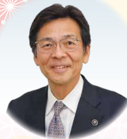
熱海市長 齊 藤 栄