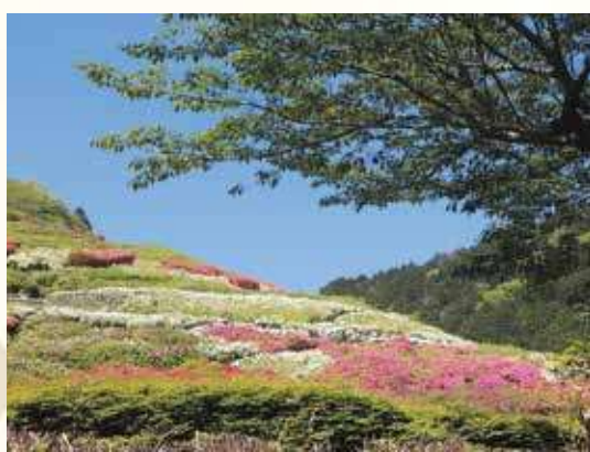
姫の沢公園 ツツジ園

また、1人でお店に入っても、お店の人や隣に座った地元の人気がさくに話しかけてくれて、気付くと観光客の人とも自然に会話が広がり、いつの間にか居心地のよい時間が流れてい