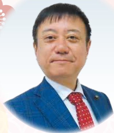
熱海市議会議長 赤尾 光一