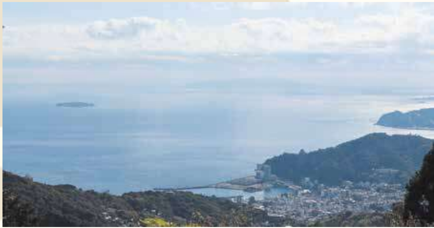
姫の沢公園から望む熱海市街

と一緒に考え、プロモーション につなげていくことだと考えて います。そうした取り組みを通 じて、市民の皆さんや旅行者、 事業者の方にとっても、「ここ に来て良かった」と思えるまち づくりに貢献していきたいです。 また、10月から日本語と英語 でイン스타그램、フェイス ブック、エックスの運用を始め ました。今後は、プレスリリー スやSNSを活用しながら、熱 海の多様な魅力やイベントを、 市民の皆さんを含め、日本、そ して世界に発信していきます。 市長 100年後の温泉リゾートを 目指して、これから新しい目標 を立てていくというタイミング に、素晴らしいメンバーが集ま りました。財源も確保できて、 熱海観光局という皆さんの活躍