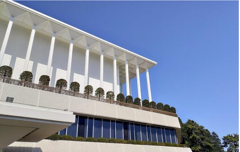
救世会館 (多数傷病者訓練)