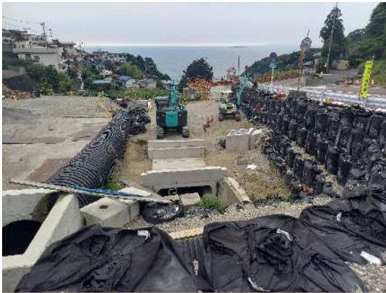
河川・道路工事实施中 市道伊豆山神社線 R6.8