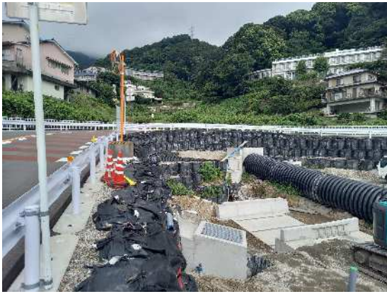
河川工事予定箇所 市道伊豆山神社線上流部 R6.8