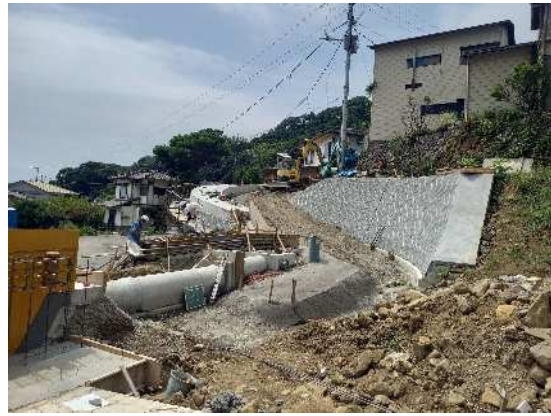
道路工事实施中 市道岸谷2号線 R6.8