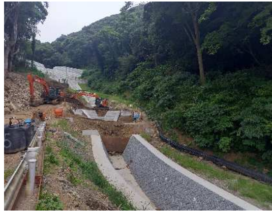
砂防工事实施中（流路工） R6.8