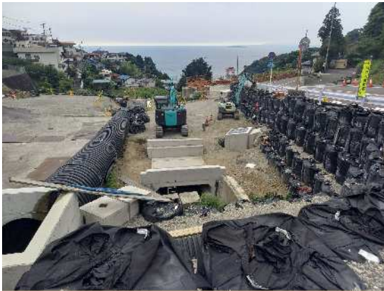
河川・道路工事实施中 市道伊豆山神社線 R6.10