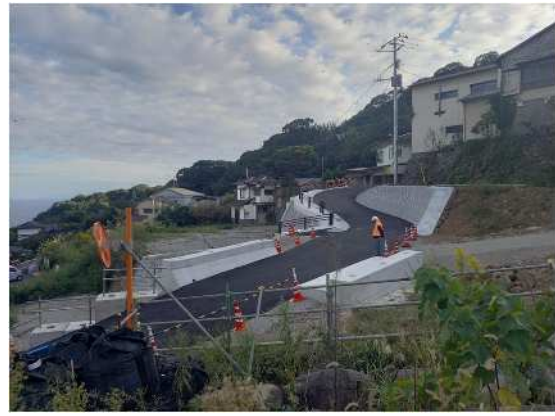
道路工事实施中 市道岸谷2号線 R6.10