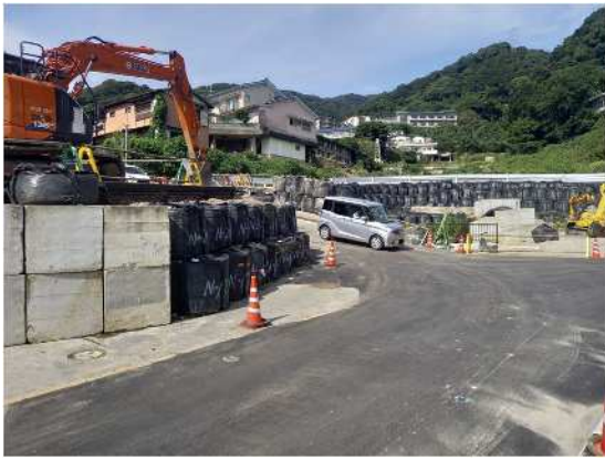
河川工事予定箇所 市道伊豆山神社線上流部 R6.10