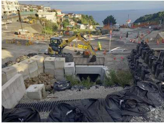
河川・道路工事实施中 市道伊豆山神社線 R6.10