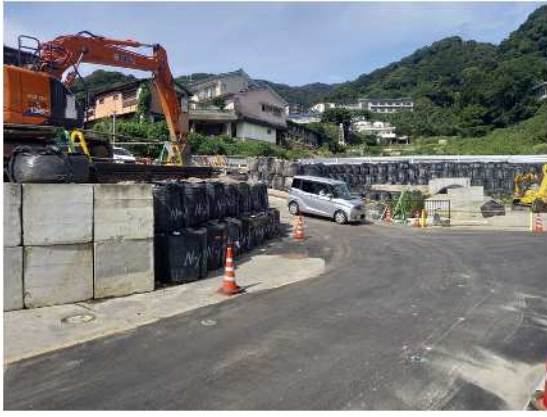
河川工事予定箇所 市道伊豆山神社線上流部 R6.10