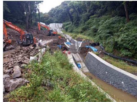
砂防工事实施中（流路工） R6.10