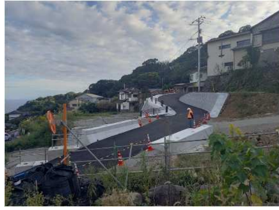
道路工事实施中 市道岸谷2号線 R6.10