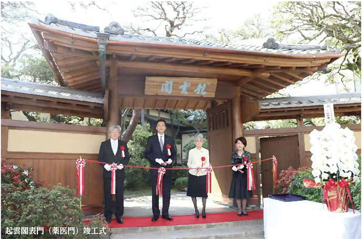
起雲閣表門（薬医門）竣工式