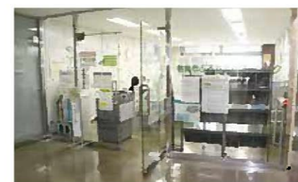
県熱海総合庁舎2階ハローワーク入口 不安なことは相談員がサポートします