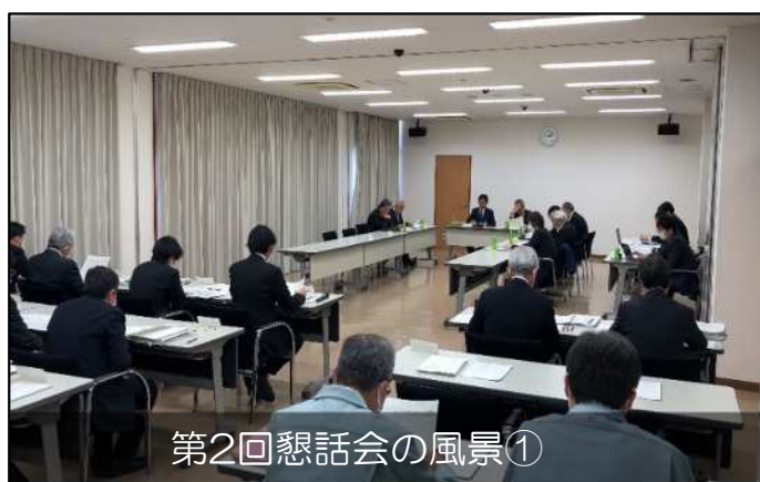
第2回懇話会の風景①

その他にも委員の皆様からいただいた意見については、それぞれ対応策を練り、次回の懇話会にてお示しする予定です。第3回の懇話会については、開催に向けて準備を進めております。