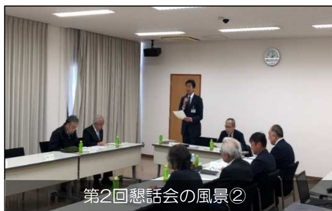
第2回懇話会の風景②