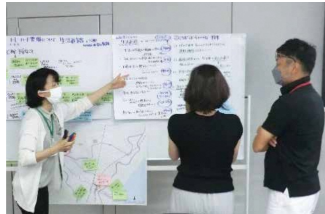
令和4年6月 伊豆山復興まちづくりワークショップ