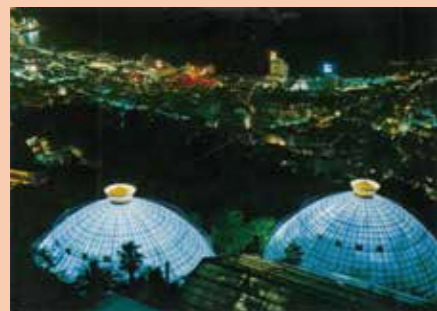
山側から見る熱海の夜景 ～昭和40年代前半～

絵葉書(熱海市立図書館蔵)より 写真手前がサポテン公園の円形ドームです。 歴史資料管理室 ☎0557(48)7100