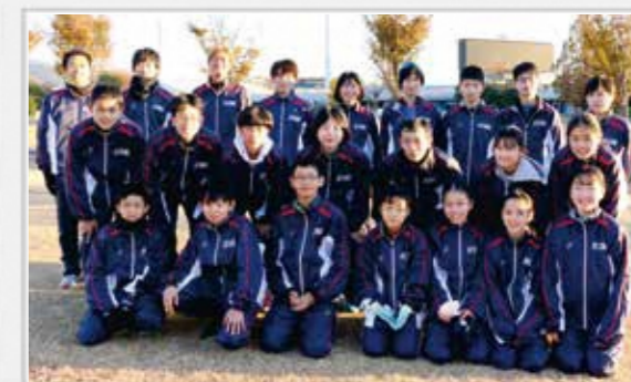
第22回熱海市代表チーム