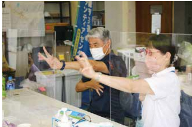
令和4年6月 伊豆山の居場所づくり(体操の様子)