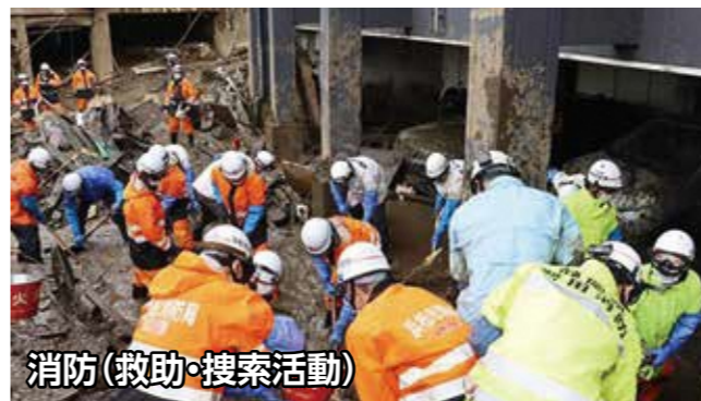
消防(救助・搜索活動)