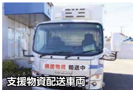
支援物資配送車両