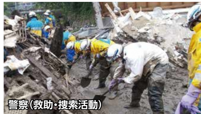
警察(救助・搜索活動)