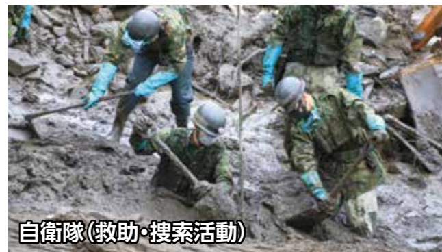
自衛隊(救助・搜索活動)