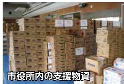
市役所内の支援物資