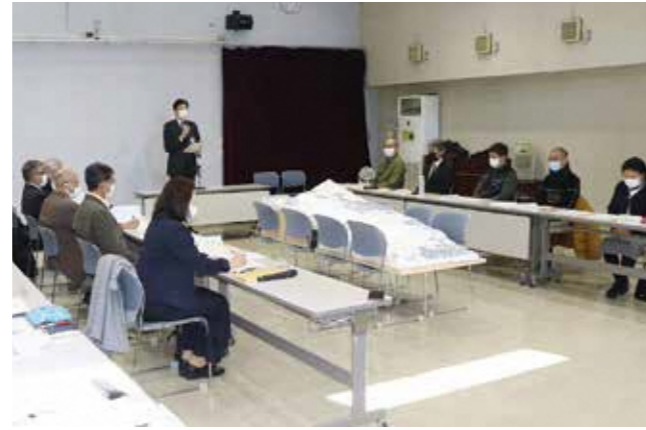
令和4年2月 伊豆山復興計画検討委員会