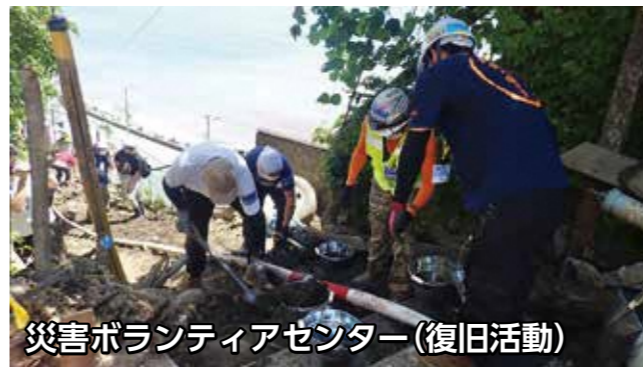
災害ボランティアセンター(復旧活動)