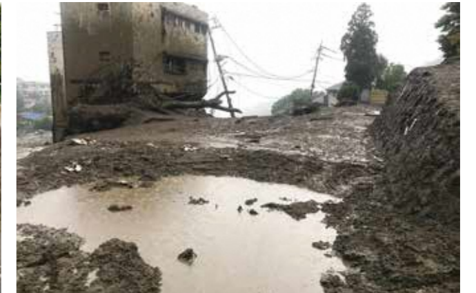
市道伊豆山神社線