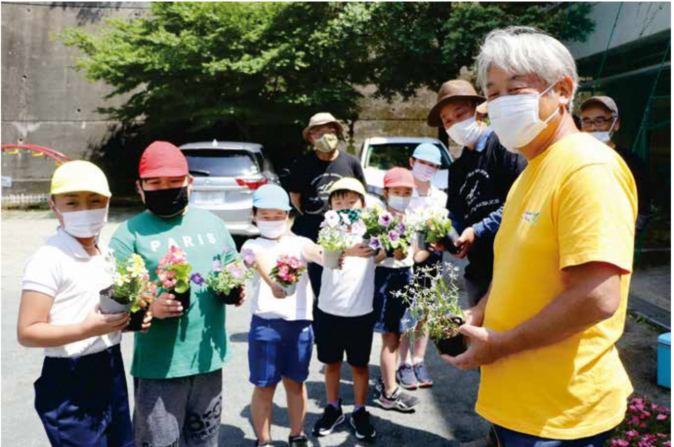
ハヶ岳グリーンネットワークさんから伊豆山小学校へ「花の苗」が贈呈されました