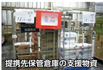
提携先保管倉庫の支援物資