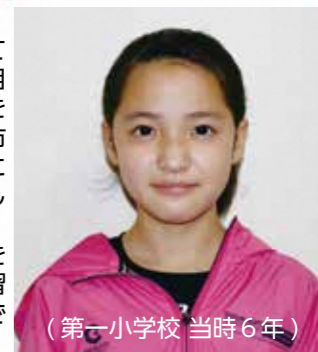
(第一小学校 当時6年)

熱海市の代表として駅伝に出場するのを目標にして陸上の練習をしてきました。熱海市のユニフォームを手にした時は本当に嬉しかったです。今年こそはロードを走れるように強化練習にも真剣に取り組んでいきたいと思っています。