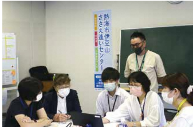
令和3年10月開設 ささえ逢いセンター