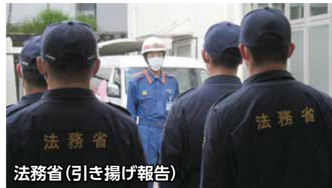
法務省(引き揚げ報告)