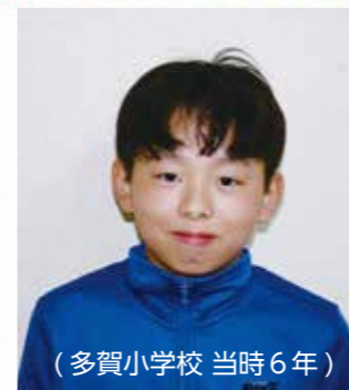
(多賀小学校 当時6年)

初めて出場した駅伝でも緊張しましたが、学年のみならず応援のメッセージが入った旗をもらったので、自信がつき最後まで全力で走り切ることができました。ありがとうございました。