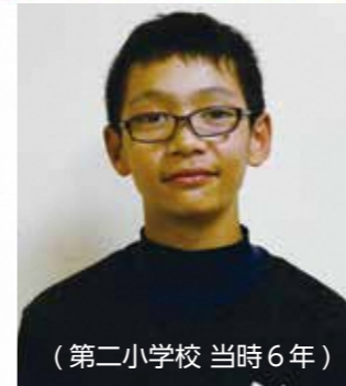
(第二小学校 当時6年)

去年は1,500mを走りました。競技場を走るのはすごく緊張しました。みなさんの応援のおかげで頑張ることができました。