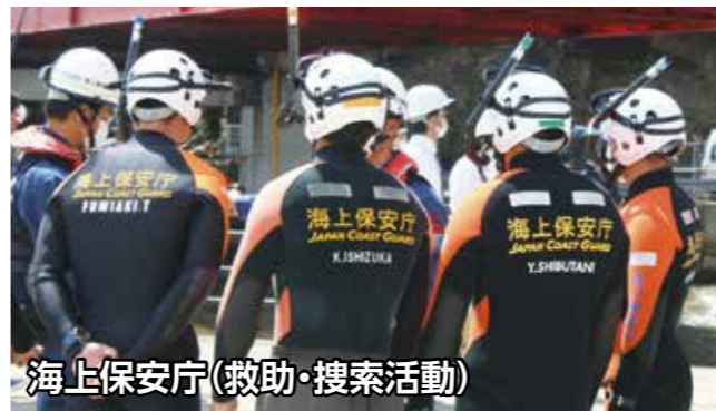
海上保安庁(救助・搜索活動)