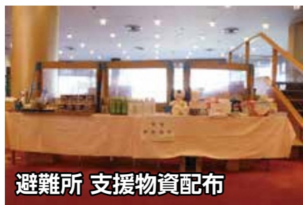
避難所 支援物資配布