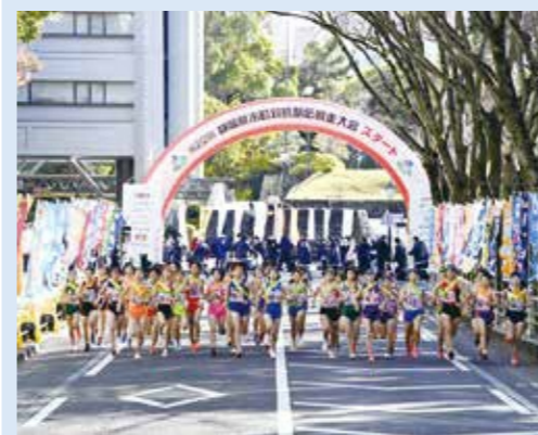
【写真】第22回静岡県市町対抗駅伝競走大会スタート写真

スポーツ推進室 ☎0557(86)6603 ID1007439 FAX:0557(86)6297 メール:sports@city.atami.shizuoka.jp