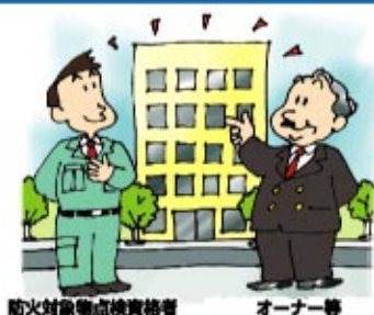
防火対象物点検資格者 オーナー等