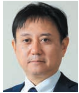
あか お こういち 赤尾光一 議員

熱海成風会 ◆ 所属委員会 ◆ 観光建設公営企業委員会 (委員長) 広域行政推進特別委員会