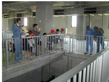
社会科見学の様子 きれいになった水を観察中