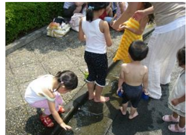
下水道は水環境を守ります