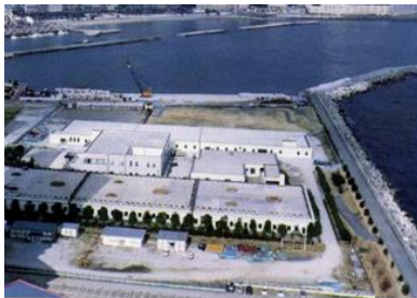
浄水管理センター