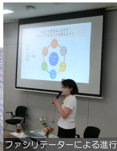
ファシリテーターによる進行