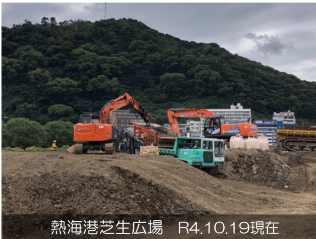
熱海港芝生広場 R4.10.19現在