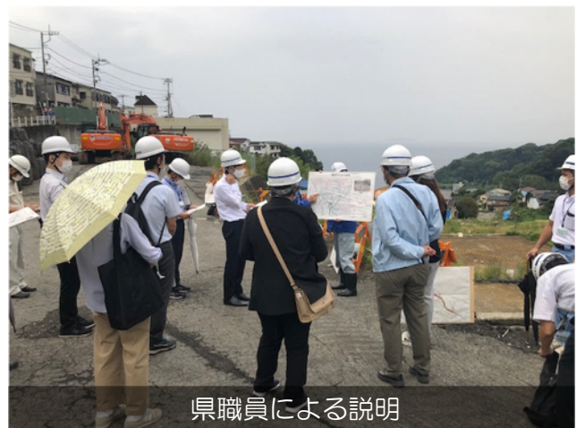
県職員による説明

令和4年9月29日(木) 国土交通省、中部地方整備局、静岡県、熱海市にて被災地の現地視察を行いました。