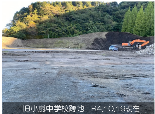
旧小嵐中学校跡地 R4.10.19現在

現在、旧小嵐中学校跡地に仮置きされている土砂約17,000m 3 の分別は完了。熱海港芝生広場に仮置きされている土砂約16,000m 3 のうち約9割の分別が完了しました。(10月19日現在)