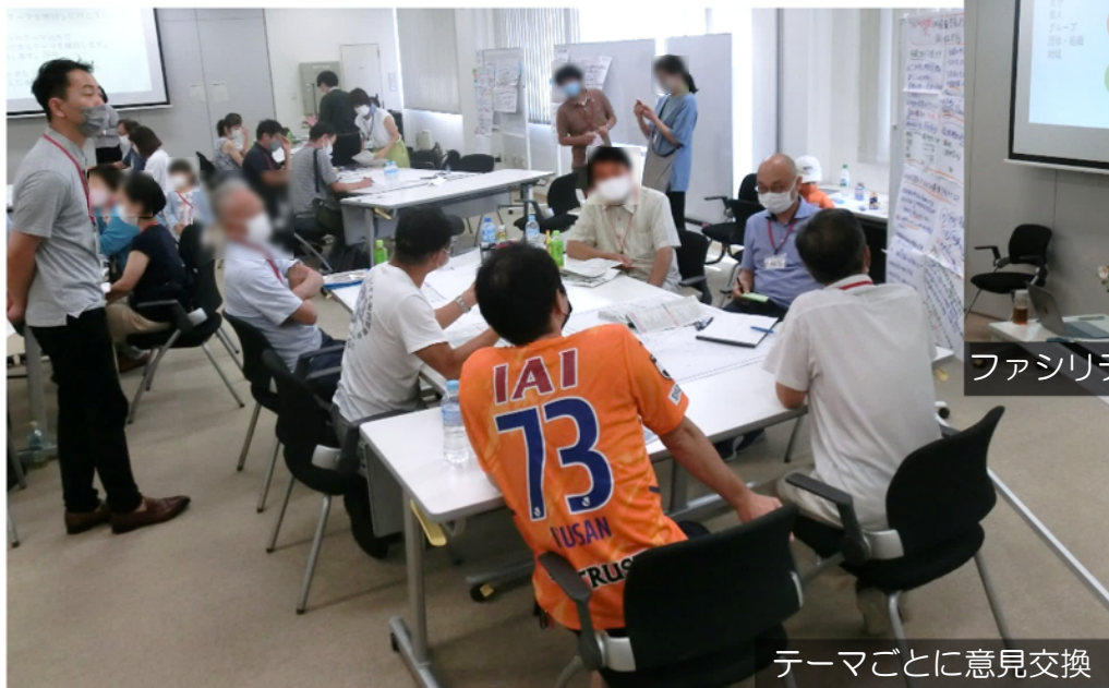
テーマごとに意見交換

今後も復興事業を進めていく際に、みなさまのご意見を事業に反映する一つの方法として、このような会を開催したいと考えていますので、ご協力をお願いします。