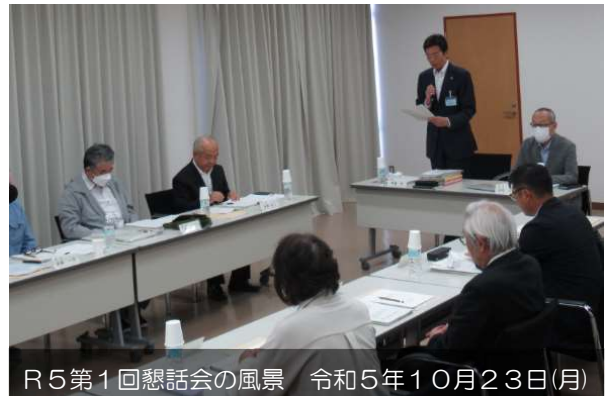
R5第1回懇話会の風景 令和5年10月23日(月)