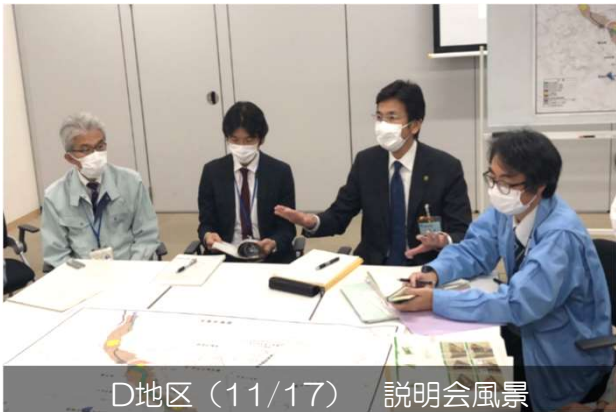
D地区 (11/17) 説明会風景