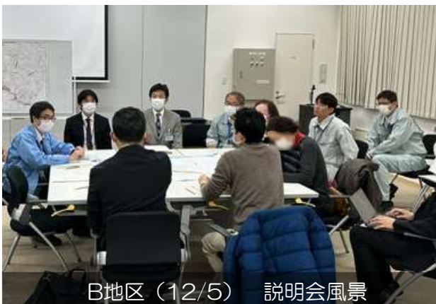
B地区 (12/5) 説明会風景

下記日程にて、「地区別説明会」を開催いたしました。説明会でいただいたご意見などは、今後の復興事業の参考とさせていただきます。