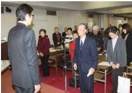
民生委員・児童委員委嘱状伝達式での決意表明

どもたちを見守り、子育ての不安や妊娠中の心配ごとなどの相談・支援などを行います。