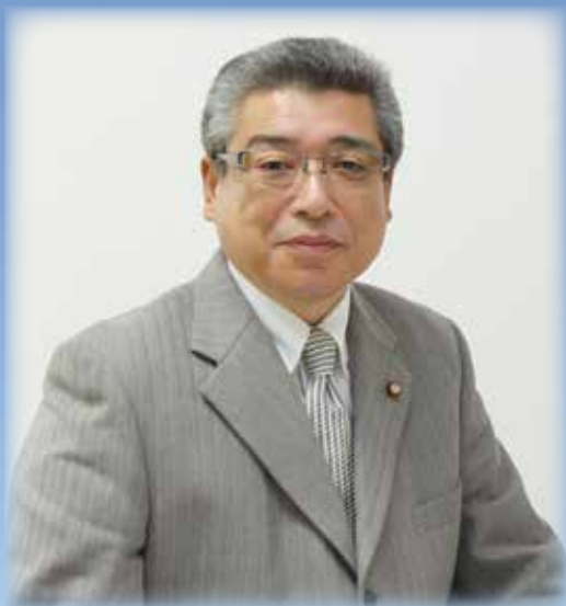
熱海市議会議長 高橋幸雄