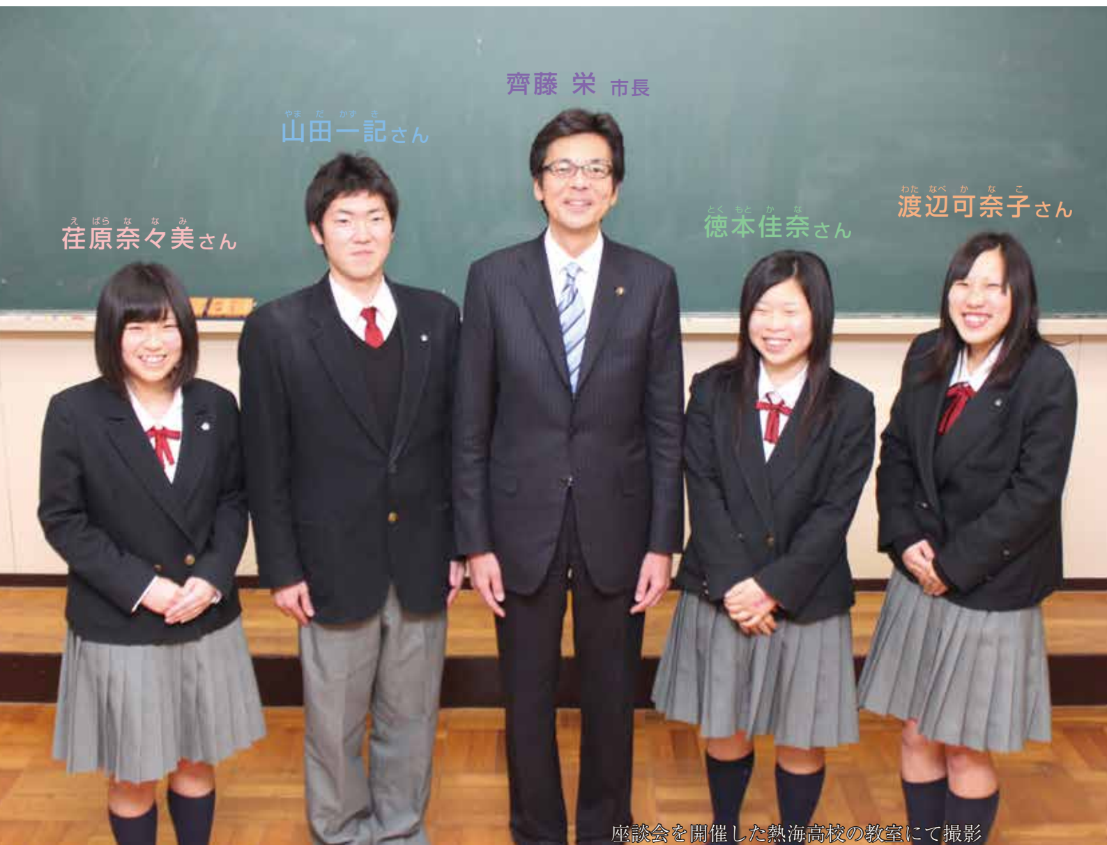
座談会を開催した熱海高校の教室にて撮影