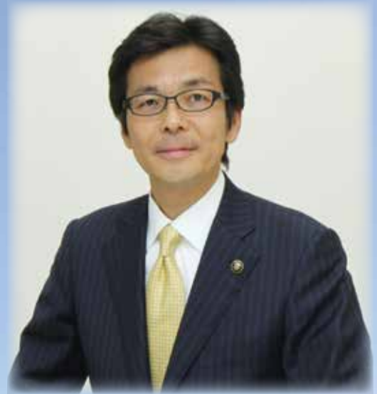
熱海市長 齊藤 栄