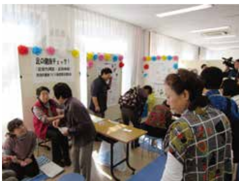
「健康まつり」での活動の様子

ぜひ、あなたも健康づくり推進委員を通じて、自身の健康の知識や活動の輪を広げてください。