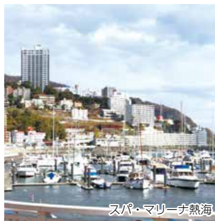
スパ・マリナー熱海