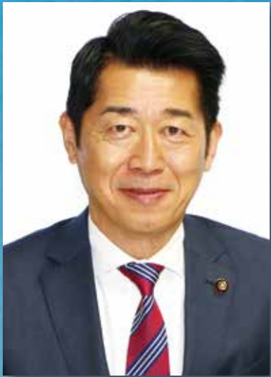
熱海市議会議長 川口 健