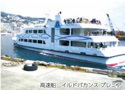
高速船 イルドバカンス プレミア

熱海の海では、数は多くありませんが、季節によってサバや、ホウボウ、サザエ、アワビなどいろいろな種類の魚介類が獲れます。その中でもメインは、アオリイカとアジです。そのほか伊豆山などでは伊勢エビが多く獲れます。漁の手法は定置網、刺網、1本釣りなどですが、近年では漁業者の人数も減っているのが現状です。 水揚げされた魚は、市内清水町にある魚市場に卸し、そこでセリにかけられ、市内の飲食店などに流通しています。そのほか、沼津や小田原などへも卸すことがありますね。市内の飲食店では「今日の地魚」として、熱海の獲れたての魚を提供しています。」