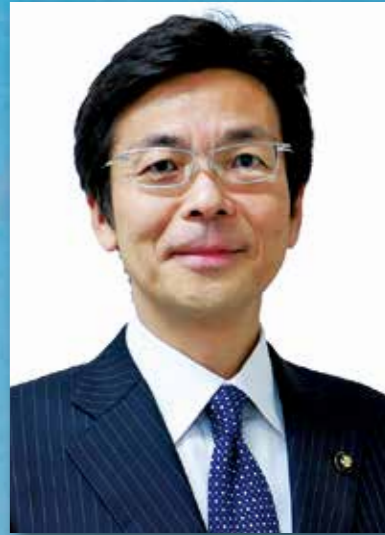
熱海市長 齊藤 栄