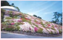
美術館に隣接する庭園には、梅やツツジ等季節の花木が整備されています。*MOA美術館は有料