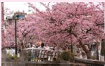
川沿いの遊歩道に54本のあたま桜が植栽されています。他にブーゲンビリア等が楽しめます。