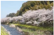
千歳川沿い(河原橋～泉大橋)に約60本の桜並木。